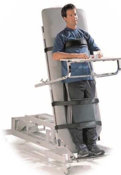
Опціональна робоча поверхня