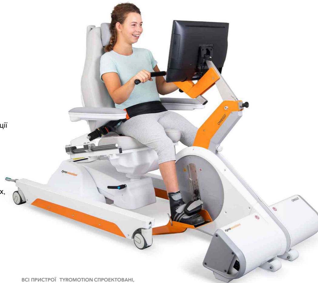
ВСІ ПРИСТРІЙ TYROMOTION СПРОЕКТОВАНИ, РОЗРОБЛЕНІ ТА ВИГОТОВЛЕНІ В ЄС.